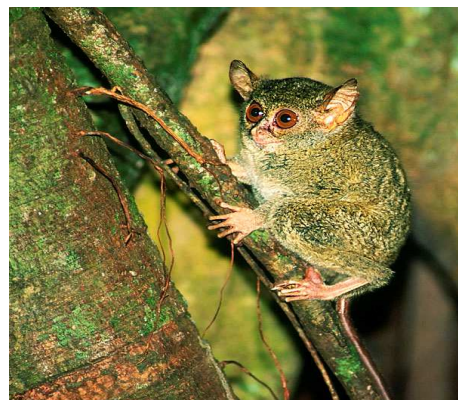
Spökdjur i Tangkoko

http://www.unep-wcmc.org/resources/PDFs/LastStand/orangutanreport_18to22.pdf